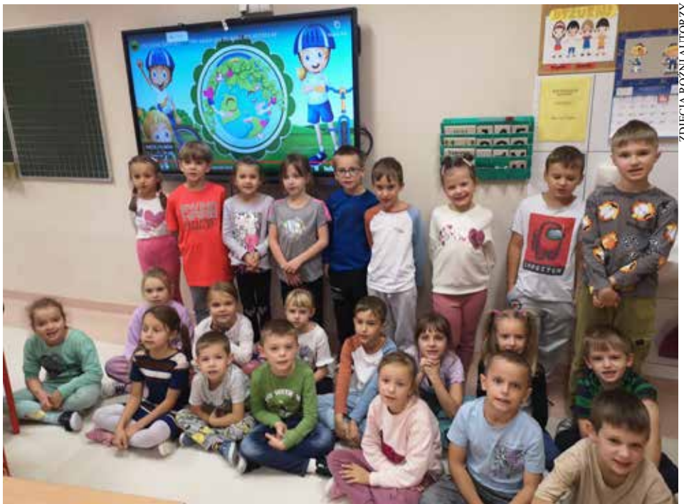
🕒 4 października to niezmiennie dzień akcji Sprzątamy dla Polski, w której każdego roku biorą udział tysiące placówek oświatowych w każdym zakątku naszego kraju. Z naszej szkoły w tegorocznej edycji uczestniczyły klasy I i II. Program #sprzątamydlaPolski, dla wielu młodych uczestników stanowi pierwszy impuls, który budzi uważność na sprawy środowiska naturalnego. Podczas tej NAJWIĘKSZEJ LEKCJI EKOLOGII oraz dzięki wiedzy i mądrości nauczycieli, najmłodszy uczą się, że wszyscy jesteśmy odpowiedzialni za naszą Ziemię. Inicjatywa ta to przede wszystkim praktyczna lekcja ekologii. To również okazja do tego, aby budować wrażliwość na naturę i problemy Matki Ziemi.