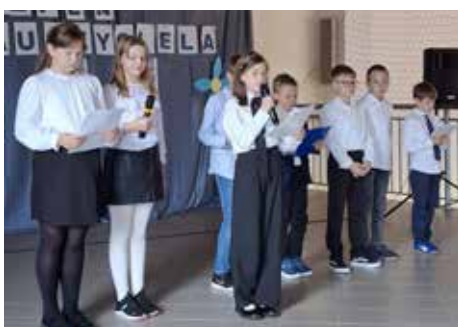
➔ Z krótkim programem artystycznym wystąpiła kl. 4.