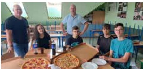
🕒 Była już klasa 8 na koniec wakacji zawitała (niestety nie w komplecie) na „egzaminową” pizzę z wychowawcą, który obiecał uczniom, że jak napiszą na odpowiedni wysoki stanin z języka polskiego to zaprosi ich właśnie na pizzę. Uczniowie się mega postarali, a wychowawca słowa dotrzymał.