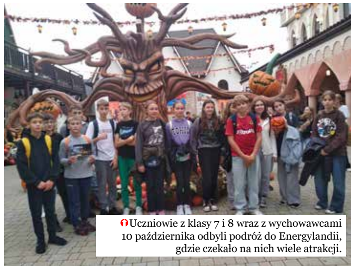
📍 Uczniowie z klasy 7 i 8 wraz z wychowawcami 10 października odbyli podróż do Energylandii, gdzie czekało na nich wiele atrakcji.