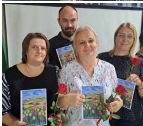
➔ Nasi niezawodni pracownicy obsługi też zostali docenieni.