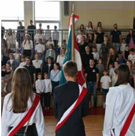
🕒 Uroczystość nowego roku szkolnego 2024/2025 miała miejsce 2 września.