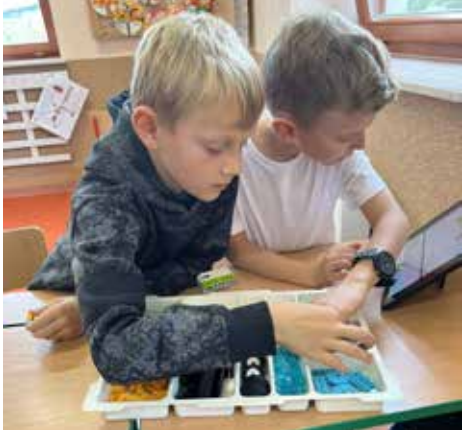
🕒 Pokazowe zajęcia z robotyki, w których uczestniczyli m.in. uczniowie z klasy III.