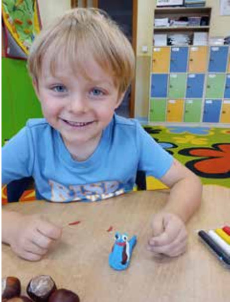
🕒 Jesień to piękna pora, dlatego nasze zerówki wykonały z plasteliny i kasztanów (które sami nazbierali i przynieśli do szkoły) piękne ślimaki.