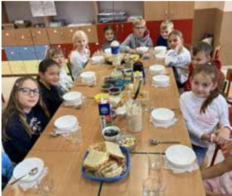
🕒 Klasa III spożywała w czwartek 3 października zdrowe śniadanie. Trzeba brać z nich przykład!