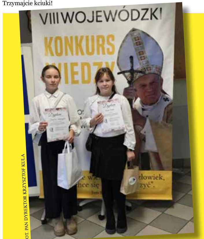
FOT. PAN DYREKTOR KRZYSZTOF KULA