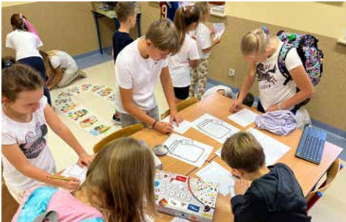
Uczniowie starszych klas chętnie zaglądali do naszych pań specjalistek.

które pomogły im zrozumieć jak ważne są emocje, jak je rozpoznawać i jak sobie z nimi radzić. Na szkolnych korytarzach zawisły karteczki z miłymi, motywującymi słowami, które uczniowie mogli zrywać, zabierać ze sobą lub podarować je innej osobie. To była prosta, ale bardzo skuteczna forma wsparcia – każdy mógł znaleźć coś, co sprawiło, że dzień stał się lepszy. Dzień zdrowia psychicznego okazał się wspaniałą okazją do rozmów o tym jak ważne jest dbanie nie tylko o ciało, ale i o umysł. Mamy nadzieję, że takie wydarzenie na stałe zagości w kalendarium naszej szkoły.