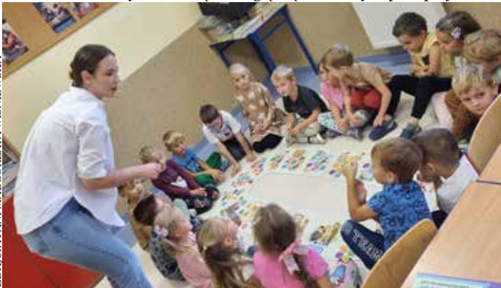
Zajęcia cieszyły się dużym zainteresowaniem.