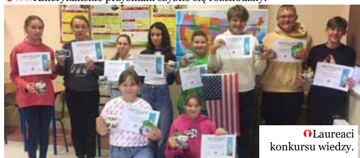
Laureaci konkursu wiedzy.