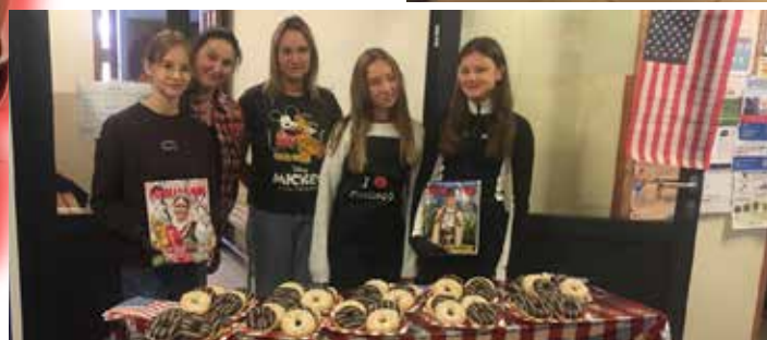
Amerykańskie przysmaki szybko się rozchodziły.