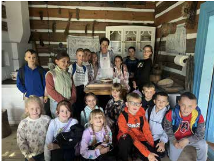
📍 Super wyjazd! Widać po uśmiechniętych minach klasy III. 📍 Uczniowie z klasy III zagłosili także na okładce.