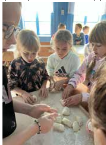
📍 Wyrabiamy ciasto na moskole.