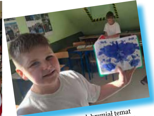
🕒 No to kleks! - tak brzmiał temat jednej z lekcji języka polskiego w kl. IV. Zajęcia nawiązywały oczywiście do lektury pt. "Akademia Pana Kleksa".